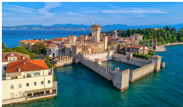
Ein weiterer sehenswerter Ort ist Sirmione