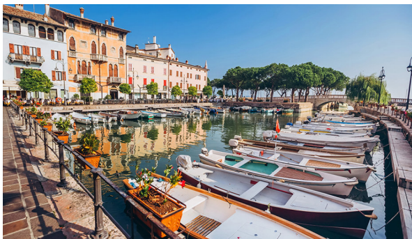
Die schöne Ortschaft Desenzano del Garda

Der Gardasee, der grösste See Italiens, erstreckt sich über die drei Provinzen Lombardei, Veneto und Trentino. Das milde Klima ermöglicht eine mediterrane Vegetation mit duftender Bougainvillea, majestätischen Palmen, Oliven- und Zitronenbäumen. In den Hügeln liegen traditionsreiche Weingüter. Die Reise führt Sie durch das Südtirol in die südliche Gardaseeregion nach Desenzano, mit eleganter Flaniermeile am See. Ein Besuch der Stadt Verona darf neben den interessanten landwirtschaftlichen Besichtigungen auf dieser tollen Reise nicht fehlen.