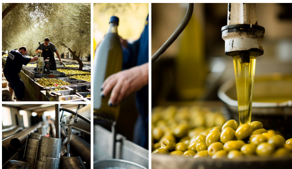
Das flüssige Gold – Olivenöl-Herstellung