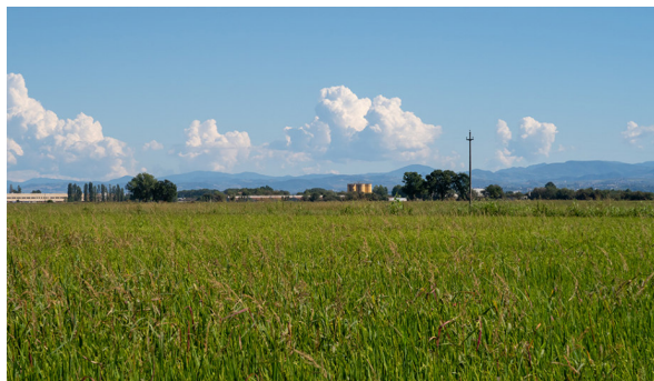
Landwirtschaftlicher Betrieb in der Po-Ebene